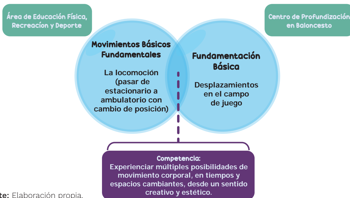
Gráfico 6. Ejemplo de una relación de contenidos del área de EFRD y los centros de profundización

Hay diferentes maneras de relacionar los contenidos del área y lo abordado en el Centro de Profundización, una es cruzar los contenidos de uno y otro espacio a fin de generar una competencia a desarrollar, tal y como se muestra en la siguiente figura: