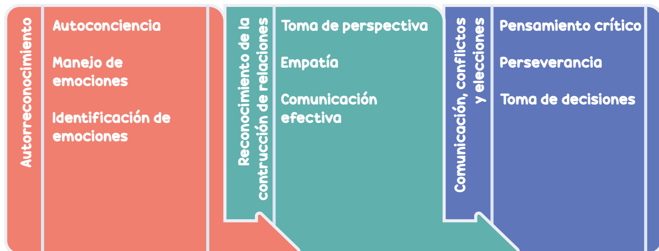
Gráfico 1. Competencias socioemocionales sugeridas en la articulación con el desarrollo de competencias para la Educación Física, la Recreación y el Deporte