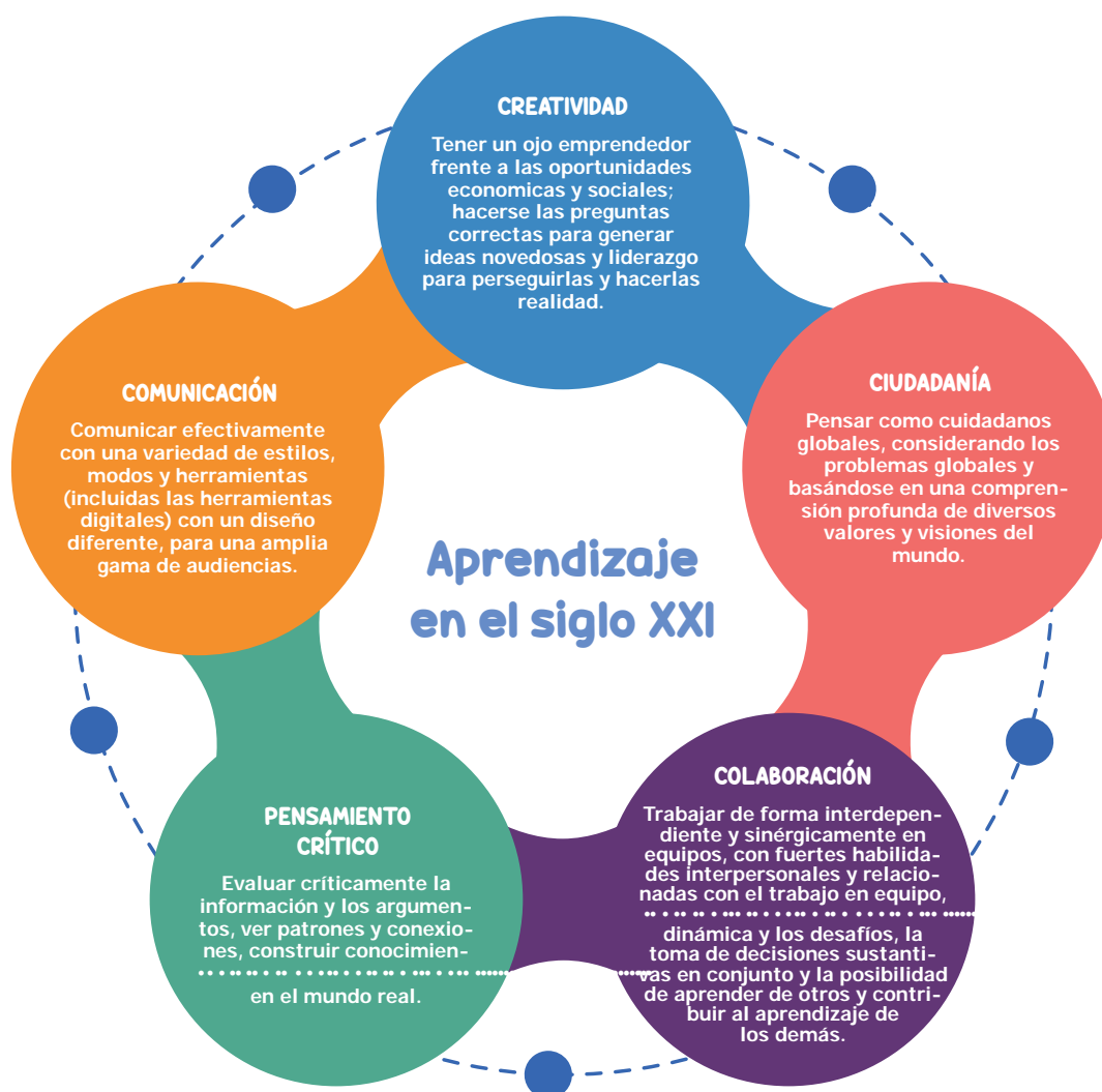
Gráfico 2. Priorización del conjunto de habilidades propuestas desde la mirada de las habilidades del siglo XXI 6CS