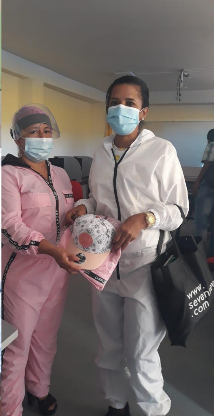
Elementos de bioseguridad para docentes estudiantes