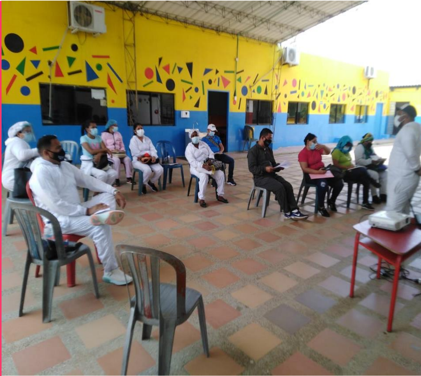
Taller con docentes