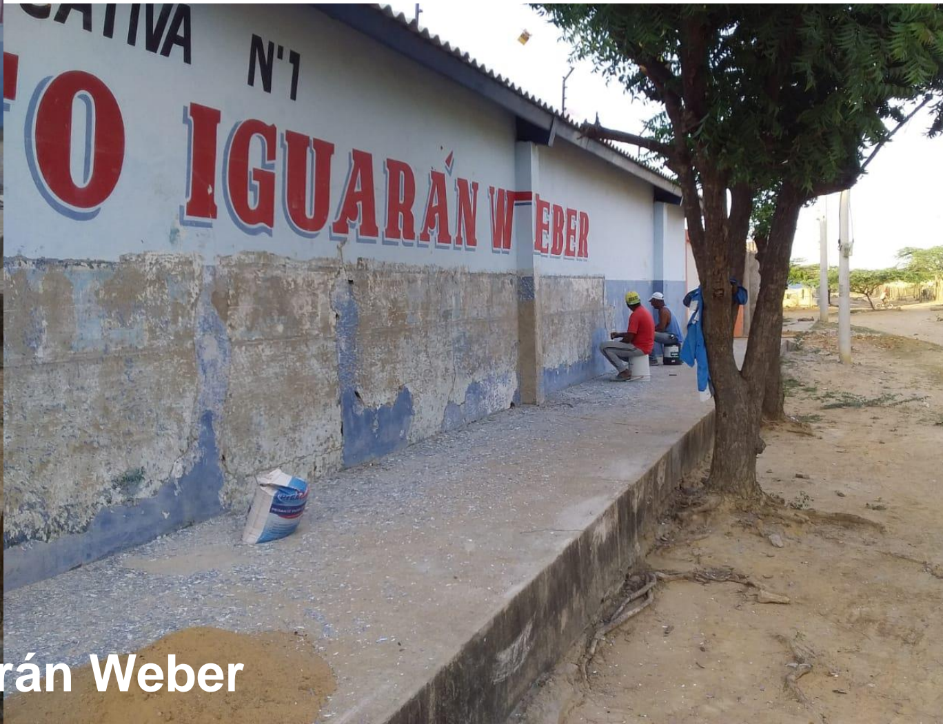
Arreglo de fachada IE No. 1 – Sede Norberto Iguarán Weber