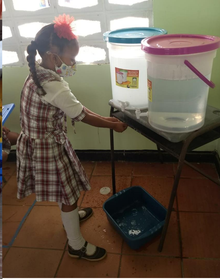
Atención a estudiantes en presencialidad