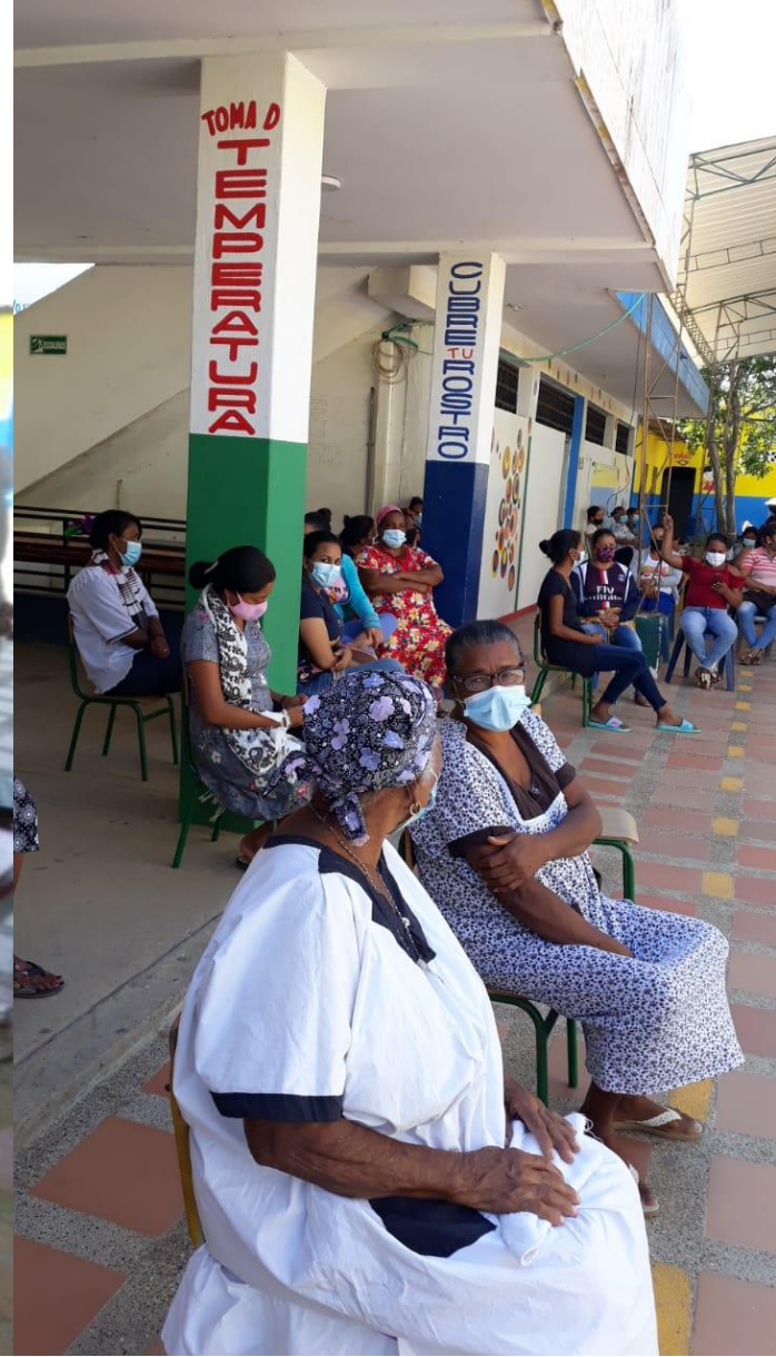
Taller con familias