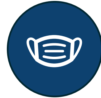
Uso de tapabocas