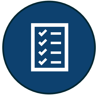
Síntomas y contactos